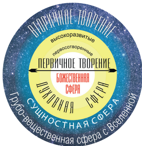
Рис. 1. Схема устройства Мироздания

Вторичное Творение вместе с видимой нами Вселенной разворачивается и сворачивается (исчезает как функциональная единица) с одинаковой периодичностью в несколько триллионов лет. По индийским Ведам указанный срок составляет 311 триллионов и 40 миллиардов земных лет.